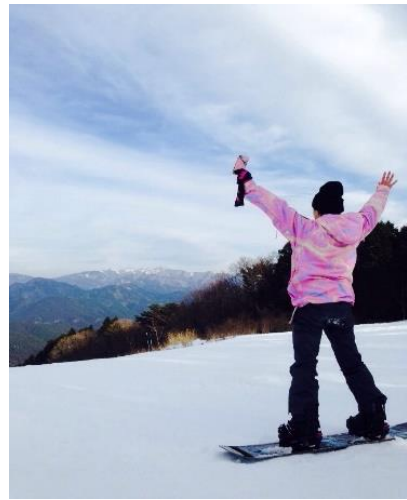
お休みの日にはスノーボードを楽しんでいます