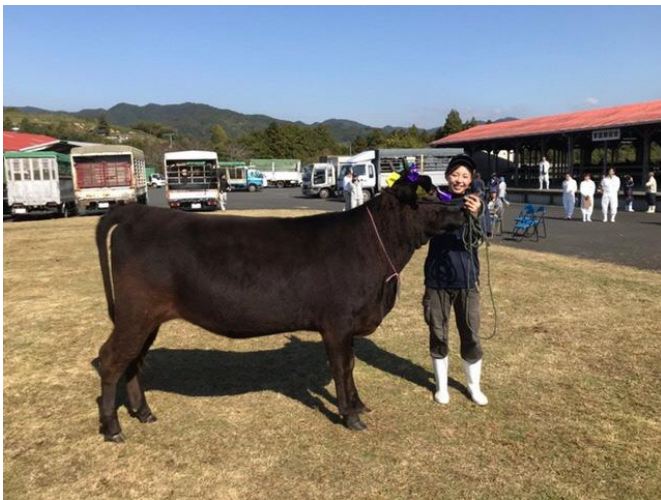
愛媛県総合畜産共進会にて