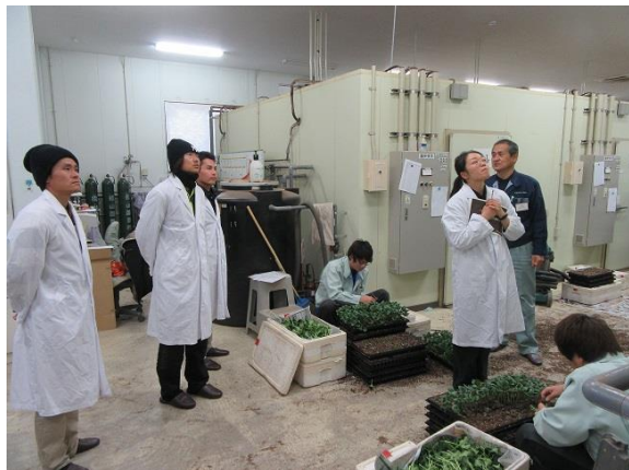
野菜の育苗について学習