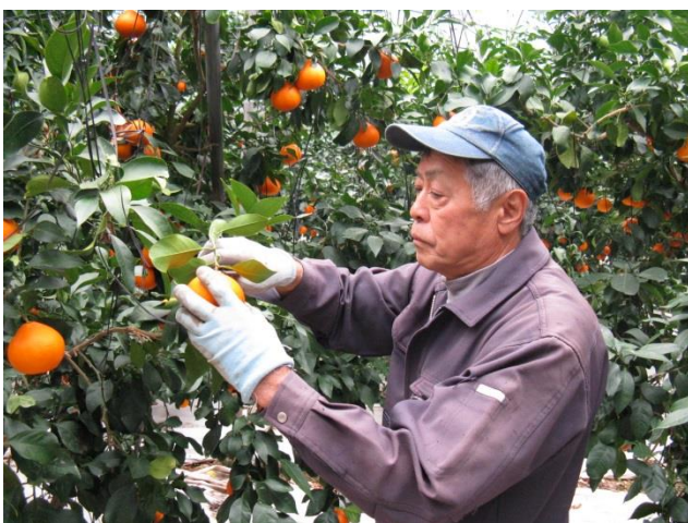
紅まどんなの収穫

最近では、紅まどんなのマルドリ栽培のほか病害虫にも強く手間がかからないアボカドが女性に人気があると聞いてチャレンジしています。