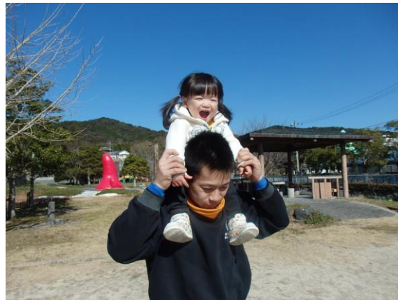
公園で家族と過ごす休日