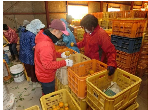
ポンカンの選別の様子