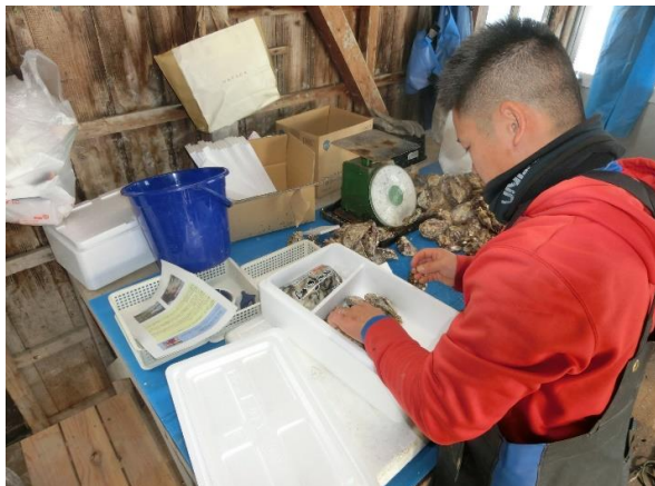
カキ出荷の箱詰め