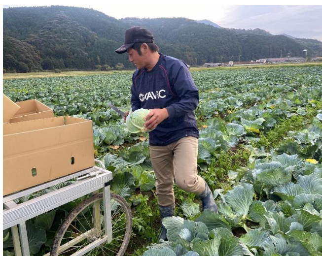
キャベツの収穫作業

また、三間町の農業を盛り上げるため、 幼馴染の農家3人と「ミマメンファーマーズ」を結成 しています。農業をしていく上での悩み等を相談しながら、一緒に頑張っていく仲間がいるのはとても心強いです。