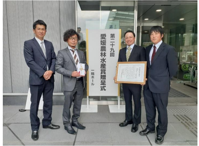
ミマメンの活動が愛媛農林水産賞を受賞！