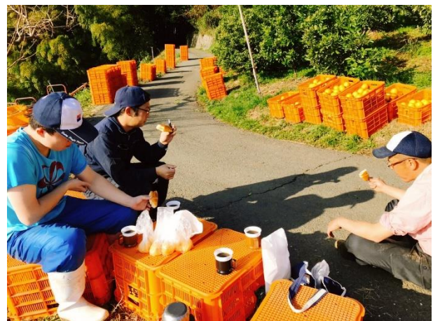
みかんアルバイトとのコーヒブレイク