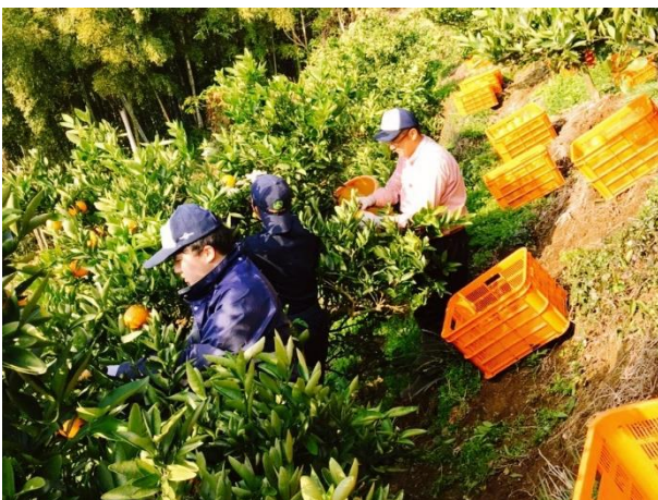
伊予柑の収穫作業

個人販売するために法人化をすることが多いと思いますが、我が社はこれからも農協に出荷し、 先人たちが築き上げてきたにしうわのみかん産地を、農協などの関係機関と一体となり守っていきたい です。