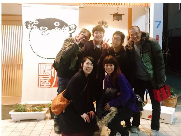
みかんアルバイトや同志会の方との親睦会