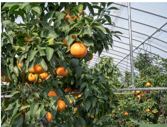
愛媛果試第28号(紅まどんな)ハウス

昨年からは、弟もUターンして経営に参画しましたので、 今後は法人化も視野に 、雇用による規模拡大を進めたいと思っています。