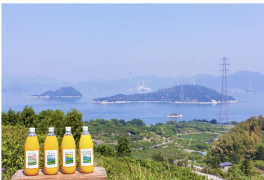
かんきつジュース