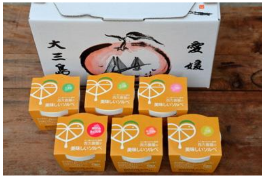
かんきつアイスクリーム