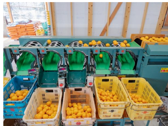
導入した大型選果機