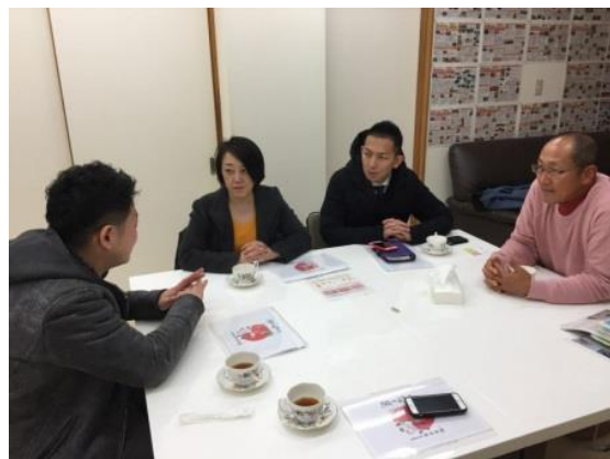
来社されたお客様への対応