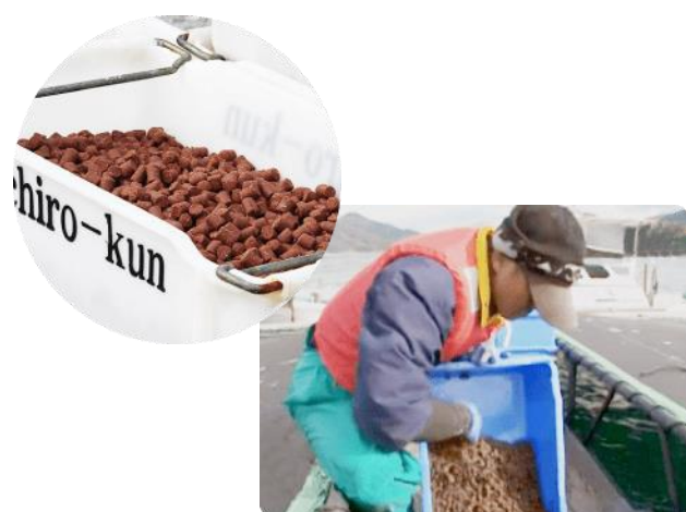
独自配合で開発した特別な餌を、 丁寧に手で餌やり

当時、「養殖の魚は臭いし、和食や加工品には向かない。天然と比べると、ずっと劣る」と言われていました(T_T)。ブランド牛もブランド鶏も高い評価を受けていますが、これらも家畜であり家禽、すなわち養殖です。だったら、養殖真鯛でも出来るはず!!! 幸い自分たちの地元は、 日本一の養殖環境と言われる宇和海(3列) 。必ずや天然を超える魚を作ってみせるぞと心に固く決め、和食や加工品に向く鯛の開発に挑戦し続けて13年間。2003年に 安心安全で、なおかつ、クオリティの高い養殖真鯛 として『鯛一郎くん』ブランドを立ち上げました。