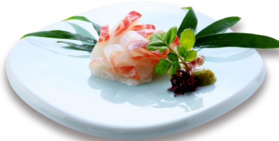
ブランド真鯛「鯛一郎クン」を使って頂いている各地のお客様を訪問し、営業活動を通して信頼関係を構築