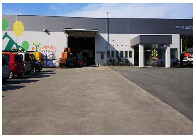
会社の正面玄関から

学校給食へは、当社でカット・個包装して納品。ジュース・シャーベット・ゼリーなどの加工事業にも取り組んでいるが、 あくまで青果が勝負。原材料を購入する大手の加工業者の真似はしません。