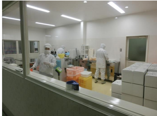
学校給食用にカットしたみかんを個包装