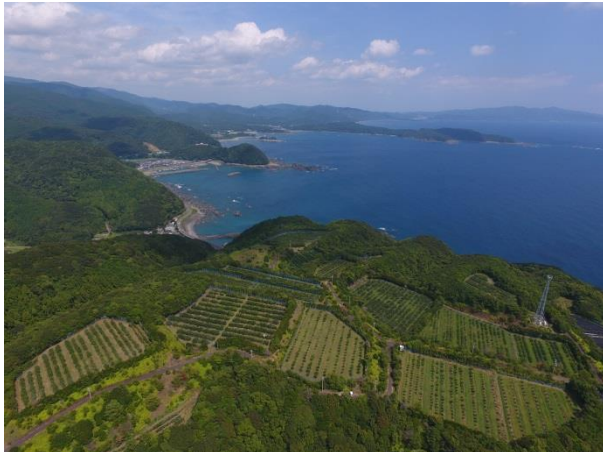
一ヶ所で5haを超える園地