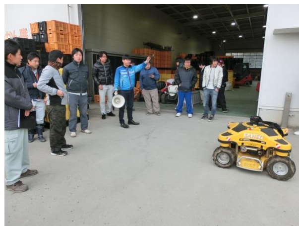
視察も多くラジコン式草刈り機の実演